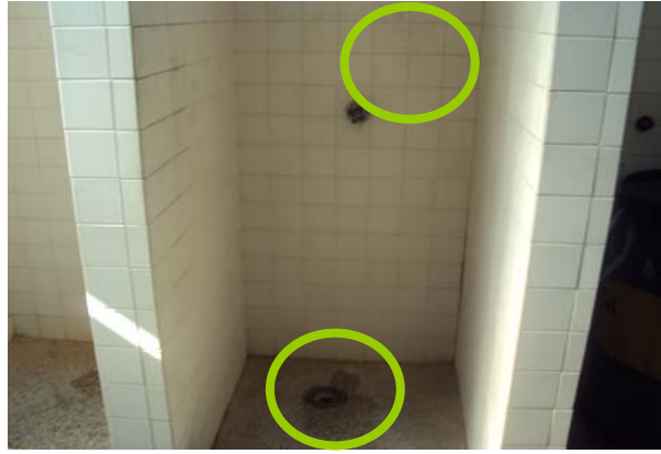
Figura 9. Sucio tanto de las paredes como del suelo de las duchas en los baños de la USB