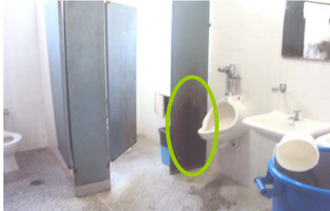
Figura 6. Deterioro de la puerta (oxidación) en los baños de la USB