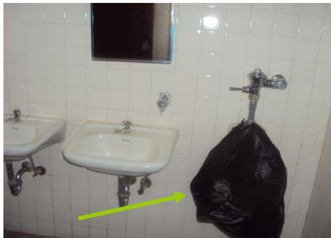
Figura 7. Urinarios dañados en los baños de la USB