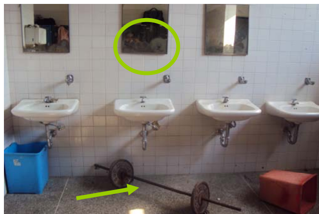
Figura 5. Deterioro en los espejos y uso incorrecto de los espacios de los baños de la USB