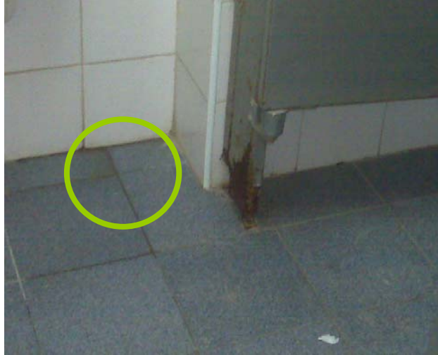
Figura 1. Sucio en las baldosas de los baños de la USB

Estado generalizado de los baños de la USB