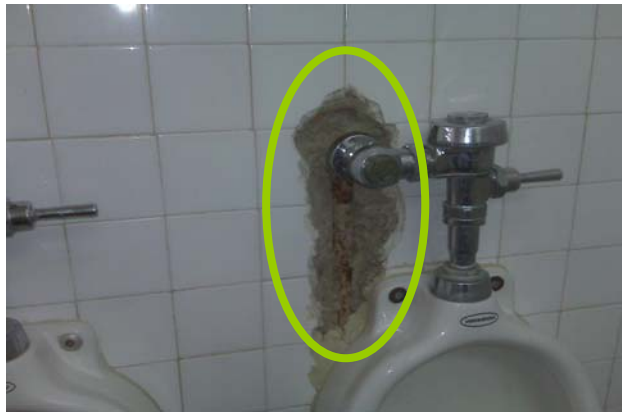
Figura 4. Filtraciones en las paredes de los baños de la USB