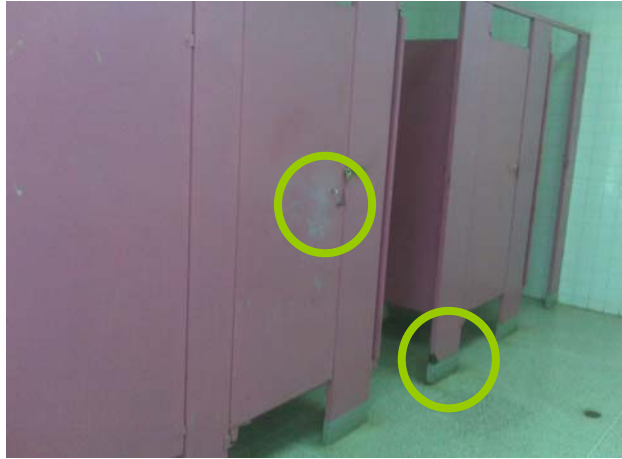
Figura 3. Deterioro en las puertas de los baños de la USB