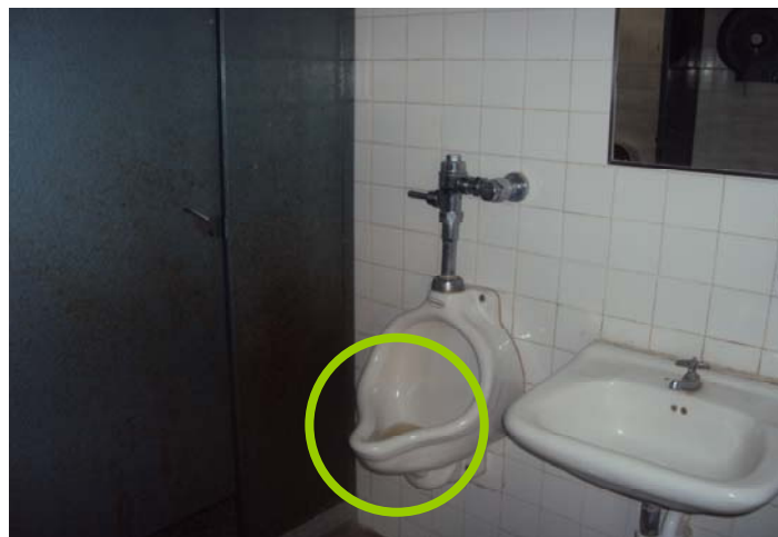
Figura 8. Urinarios tapados en los baños de la USB